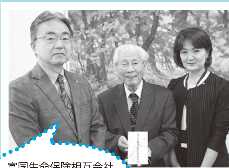
富国生命保険相互会社 鳥取支社様より

【参加申込み・問い合わせ】 米子ファミリー・サポート・センター(ふれあいの里2階) ☎32-0016/FAX32-0026