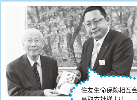
住友生命保険相互会社 鳥取支社様より

誠にありがとうございます。 三月二十四日に「株式会社寿電気様より五〇、〇〇〇円、三月三十一日には「住友生命保険相互会社 鳥取支社」様より一四、七三三円のご寄付をいただきました。また五月二十三日には「富国生命保険相互会社 鳥取支社」様よりフコク生命チャリティコンサートへの募金二五〇、五〇〇円、五月二十八日には「蓮華会」様よりチャリティ公演の募金三五〇、〇〇〇円のご寄付をいただきました。 いただいたご寄付は市民のみなさんのため社会福祉活動の推進に活用させていただきます。