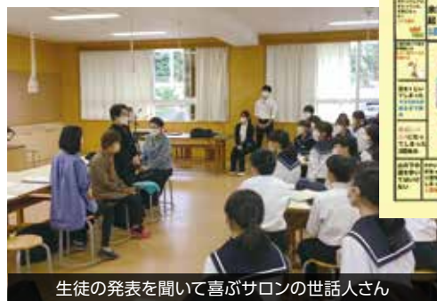
生徒の発表を聞いて喜ぶサロンの世話人さん