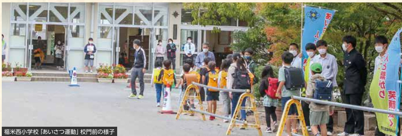
福米西小学校「あいさつ運動」校門前の様子