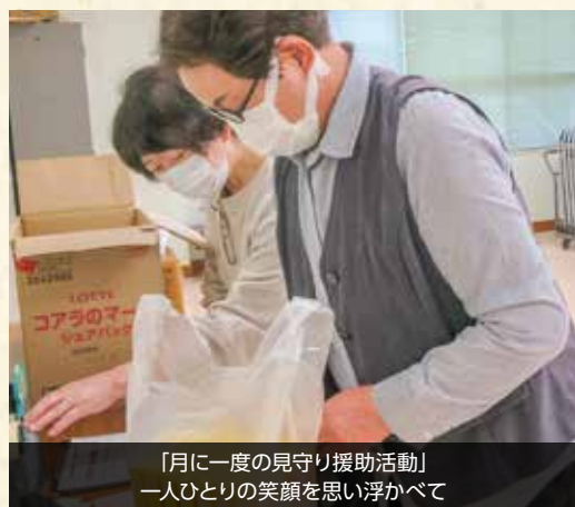
「月に一度の見守り援助活動」一人ひとりの笑顔を思い浮かべて