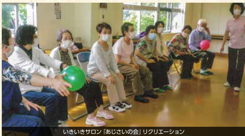
いきいきサロン「あじさいの会」レクリエーション