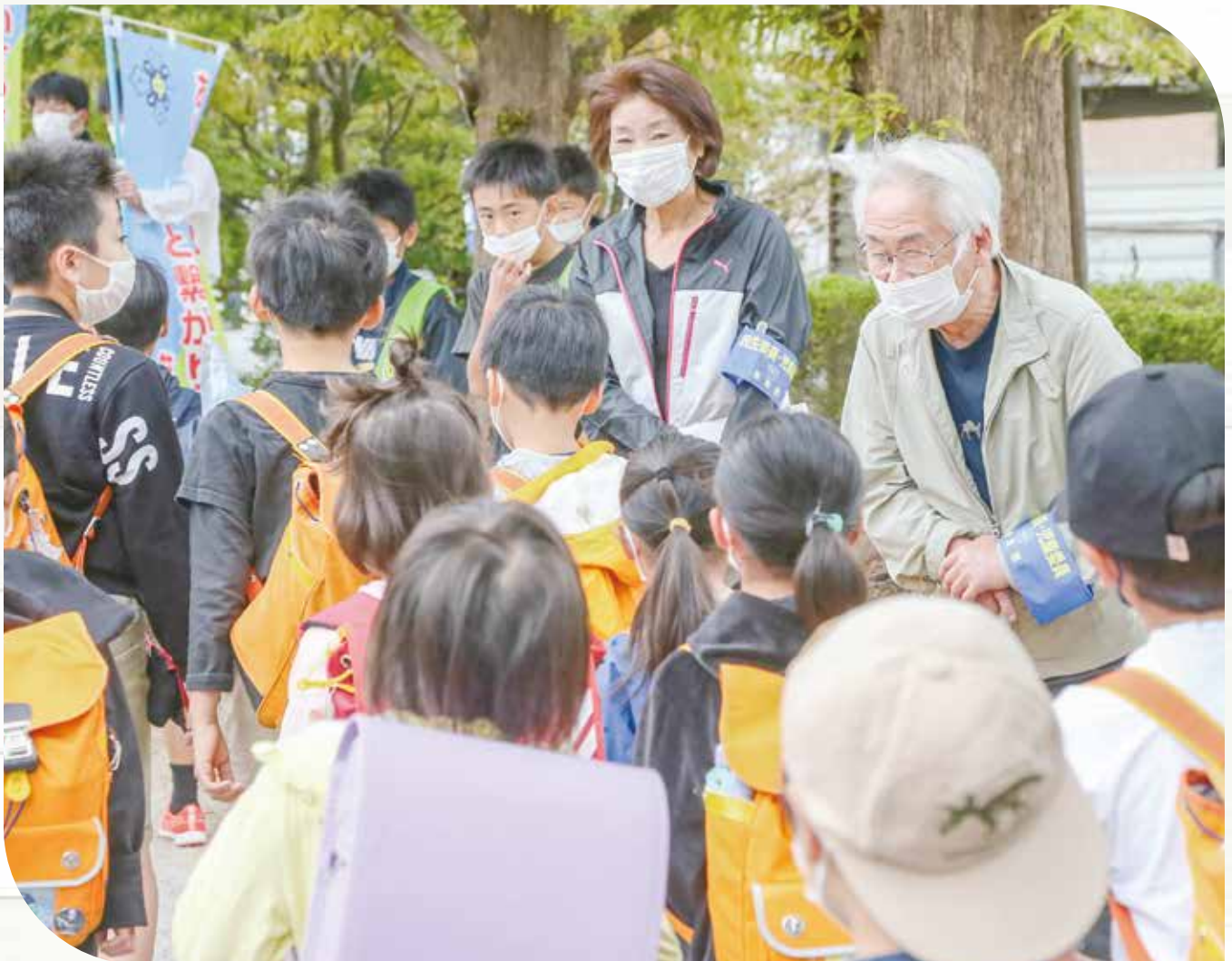
「福米西小学校 あいさつ運動」笑顔でおはようございます！