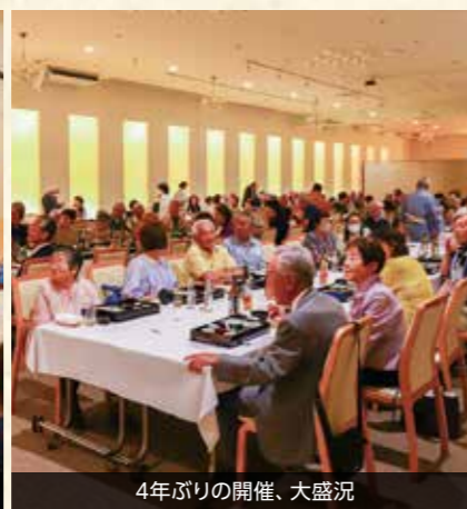
4年ぶりの開催、大盛況