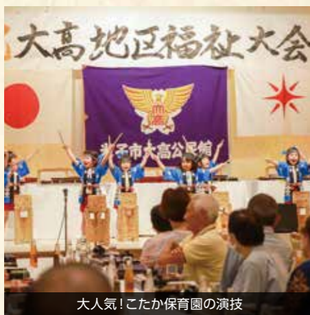
大人気!こたか保育園の演技