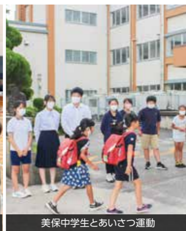
美保中学生とあいさつ運動

交流を通して、互いに認め合い、相手に思いやりをもって行動しようとする子どもの姿が見られました。今後とも様々な交流を通して、子どもたちの思いやり、つながりとする心が育っていくことを願っています。