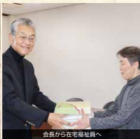
会長から在宅福祉員へ