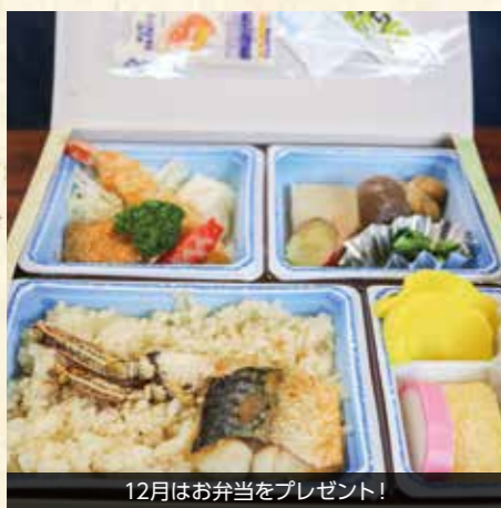
12月はお弁当をプレゼント!

米子市社会福祉協議会では、赤い羽根共同募金配分金を財源とし、市内の小・中・特別支援学校へ福祉教育費用の助成を行っています。