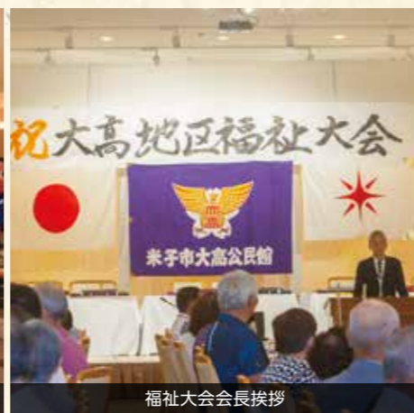
福祉大会会長挨拶