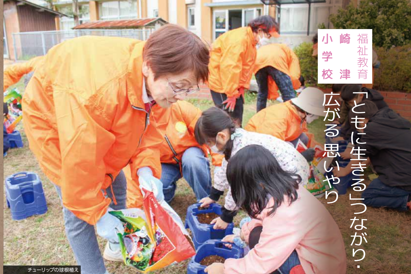
チューリップの球根植え