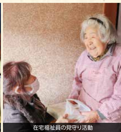
在宅福祉員の見守り活動